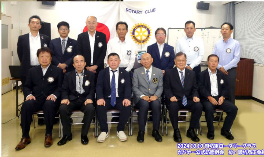
2024.10.10 岡坊東ロータリークラブ ガバナー公式訪問例会 於：岡坊高工会館