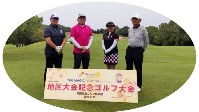
2024 地区大会記念ゴルフに参加しました。